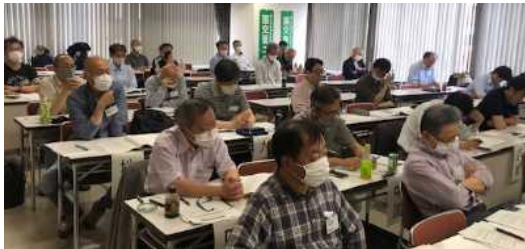
討論に参加する組合員

給与実態に合った仕事を」との意見が出されていきます。「定年延長」制度及び再任用制度は、年金支給までの生活保障の意味合いがあります。同時に不足する定員事情を補い、中堅若手への行政技術継承に資するべきと考えます。